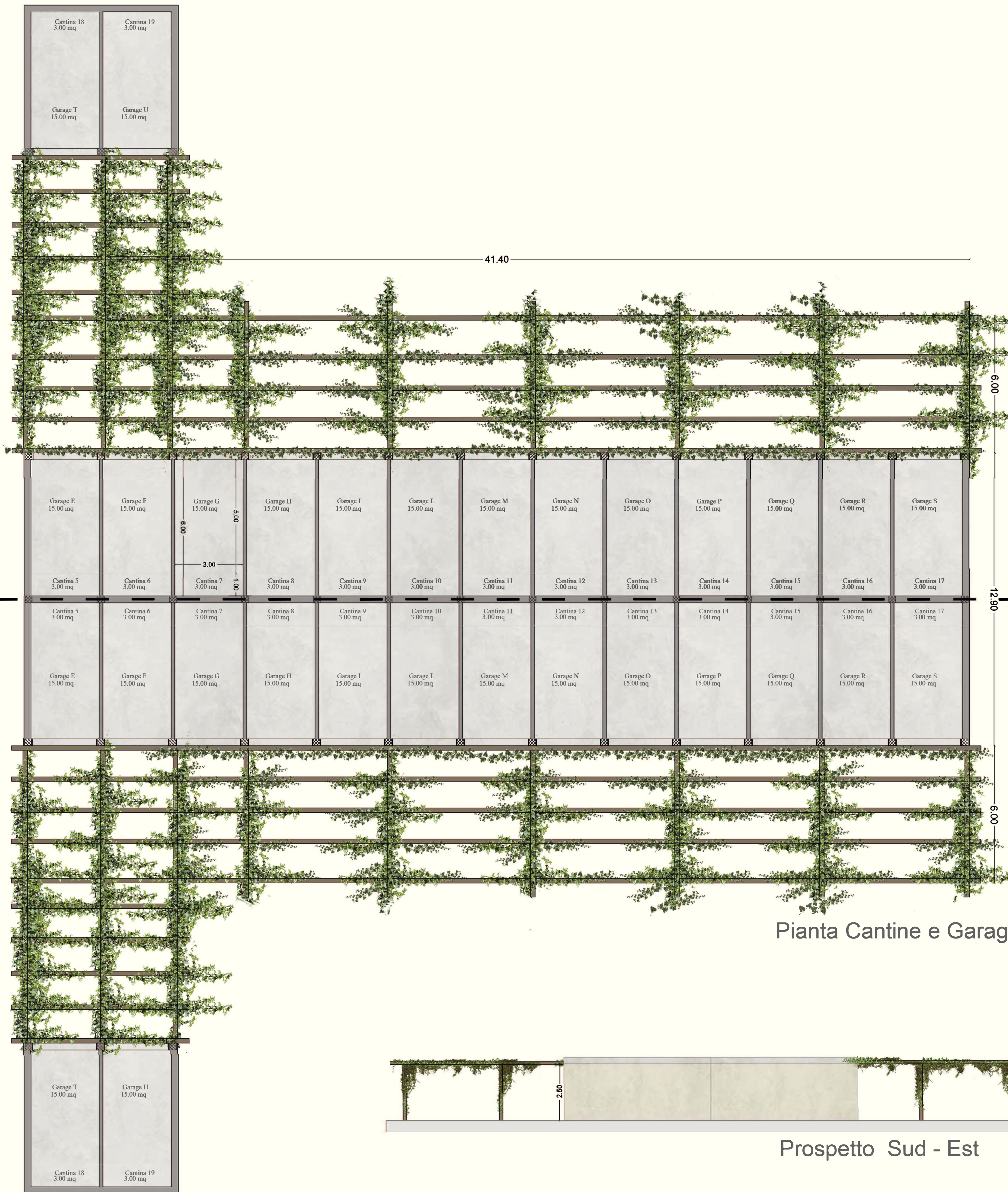
Pianta Cantine e Garage

A TERMINI DI LEGGE SI RISERVA LA PROPRIETA' DI QUESTO DISEGNO