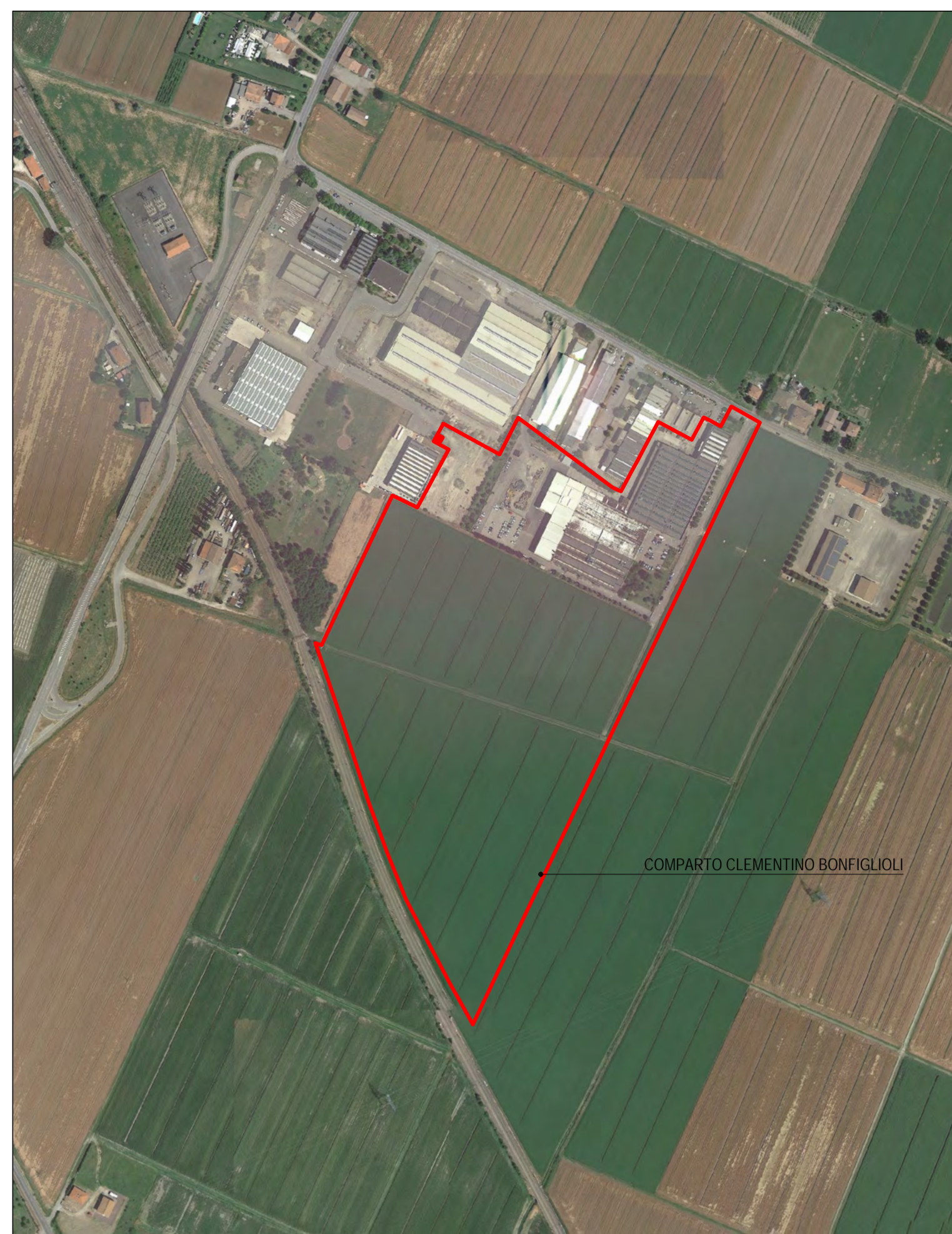
COMPARTO CLEMENTINO BONFIGLIOLI