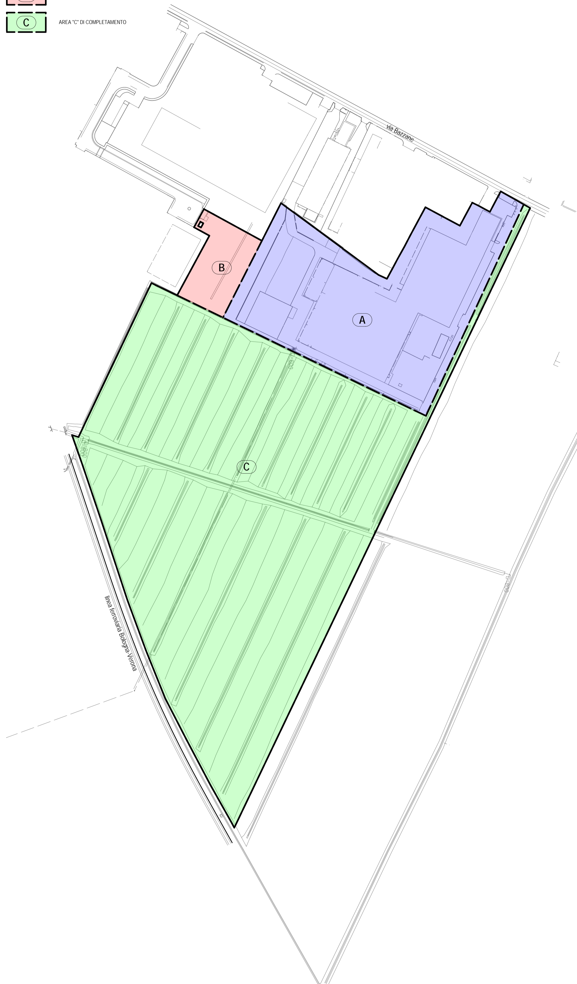
INDIVIDUAZIONE DEL COMPARTO CLEMENTINO BONFIGLIOLI SUL RILIEVO TOPOGRAFICO scala 1:2000