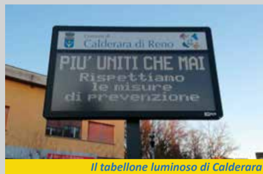
Il tabellone luminoso di Calderara

Due nuovi tabelloni luminosi saranno presto installati in altrettanti punti della città. Dopo Calderara, Longara e Tavernelle toccherà a Lippo e Castel Campeggi avere il loro totem, che come avviene per i tre già presenti trasmette informazioni utili al cittadino come avvisi, eventi, chiusure uffici e tante altre. Una trasmissione delle notizie rapida, diretta ed efficace, visibile dall'auto come dalla finestra di casa. L'installazione è prevista per l'anno in corso, e sarà un ulteriore passo di avvicinamento dell'Amministrazione alle frazioni, pensate non come quartieri periferici ma come parte importante e attiva della vita di Calderara. A Longara, per esempio, dopo il rinnovo della piazza sono previsti nuovi asfalti nelle vie principali, così come in tutte le altre frazioni. ■