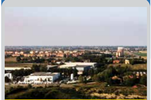
Calderara dall'alto

Il Consiglio Comunale di Calderara di Reno ha detto il sì più importante, nella fase cruciale della decarbonizzazione dell'aeroporto Marconi. Grazie alla delibera di recente approvata arriva finalmente il via libera al piano, con la creazione di una importante fascia boscata che costituirà una barriera verde tra Calderara e lo scalo e, soprattutto, permetterà un notevole assorbimento di anidride carbonica. L'ok di Calderara, decisivo perché sul territorio comunale ricade la fascia boscata in questione, riguarda un protocollo d'intesa con Enac, "Marconi" e Comune di Bologna avente ad oggetto "misure compensative e di mitigazione ambientale integrative a carico dell'Aeroporto": grazie a questa integrazione - 10 ettari in più a Lippo diventeranno presto un fitto bosco con una grande quantità di alberi a grande assorbimento di CO2 - potrà vedere la sua realizzazione l'Accordo Territoriale Attuativo, datato 2015, per la decarbonizzazione dell'aeroporto. Il progetto, che originariamente prevedeva nell'area nord dello scalo, sempre in territorio di Lippo, 36 ettari a bosco e 49,2 a colture energetiche (in particolare miscanto), con un potenziale assorbimento di 1900 tonnellate di CO2 all'anno, è stato nel tempo modificato. Ora è stata individuata a Lippo una ulteriore area di 10 ettari, di proprietà del Comune di Bologna che la trasferirà mettendola a disposizione del progetto. ■