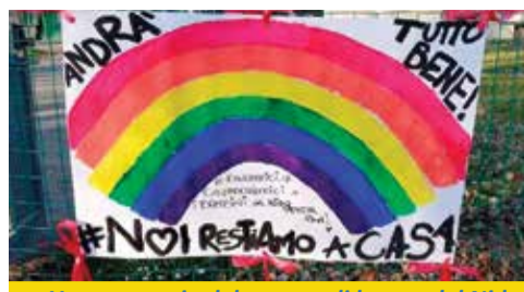
Un messaggio del gruppo di lavoro del Nido d'Infanzia Peter Pan

Precedenza alle famiglie. L'Amministrazione di Calderara di Reno si è mossa subito, all'indomani della sospensione delle scuole in Emilia-Romagna come primo provvedimento forte per contrastare la diffusione del Coronavirus, mettendo in campo 9 azioni concrete, eseguibili immediatamente, a sostegno dei nuclei familiari alle prese con uno o più bambini forzatamente a casa. Un primo, necessario aiuto, per il quale il Comune non ha avuto tentennamenti e ha reperito subito i fondi necessari. Al momento in cui questo notiziario viene terminato, le settimane di assenza da scuola sono diventate 4: arriveranno sicuramente a 6, poi il Governo valuterà se confermare le misure drastiche o revocarle in caso di cessata emergenza.