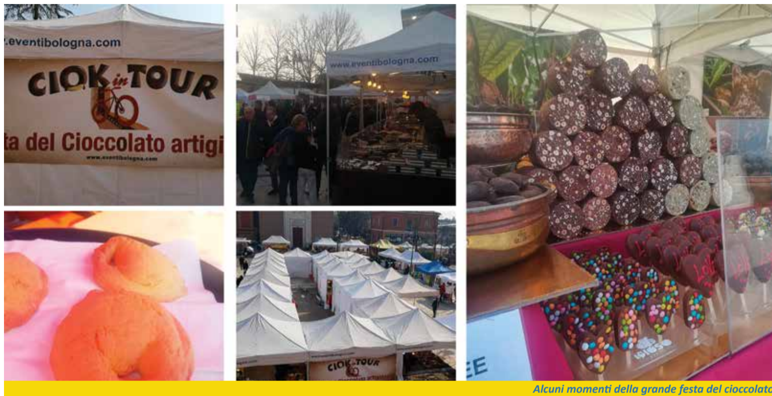
Alcuni momenti della grande festa del cioccolato

storia del cioccolato. E dopo l'anteprima la festa vera e propria lungo via Roma: i maestri cioccolatieri di Ciocchinbo, laboratori per bambini, stand per tutti i gusti. Durante la manifestazione, patrocinata dal Comune di Calderara e organizzata dalla Pro Loco Calderara Viva, da Eventi e da Ciocchinbo, è stato possibile persino assaggiare il tortello al cioccolato. ■