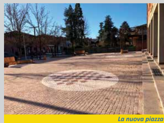
La nuova piazza

Ma c'è spazio anche per l'innovazione, nella piazza che ora attende di avere un nome: è il "pedone smart", un sistema di illuminazione e segnalazione per rendere visibile chi attraversa la strada e allertare le autovetture in arrivo. ■