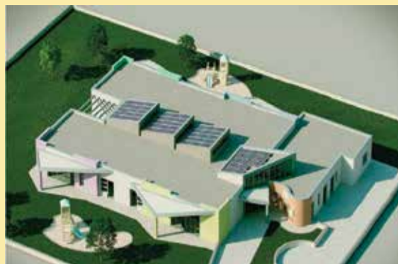
Il rendering del nuovo nido d'infanzia

Il nuovo Nido d'Infanzia sarà bello, sostenibile, innovativo. Avrà 70 posti, 4 sezioni, spazi per sviluppare la creatività con materiali naturali e un progetto pedagogico di stampo montessoriano. In via della Mimosa comincia a prendere forma, l'obiettivo è inaugurarla all'avvio della stagione 2020-2021: a impianti ormai fatti e interni ben avviati ci si comincia a sperare. Il nuovo Nido d'Infanzia sarà ospitato in una struttura con fabbisogno energetico molto basso (NZEB, nearly zero energy building), che sfrutterà in modo rilevante fonti rinnovabili, in accordo con le ultime direttive europee secondo le quali tutti i nuovi edifici pubblici dal 31 dicembre 2018 devono essere ad energia quasi zero. È realizzato con un innovativo sistema costruttivo in pannelli di legno a strati incrociati, modalità e materiali che consentono rapidità di costruzione, isolamento termico e acustico, elevata resistenza al fuoco. ■