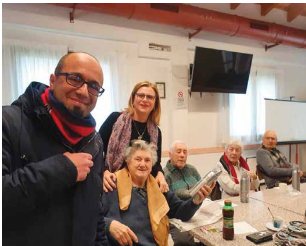
La consegna delle borracce agli anziani di Argento Vivo

La deplastificazione di Calderara prosegue. Un Comune che vuole essere quanto prima plastic free deve sensibilizzare tutti i suoi cittadini, dai più piccoli ai più anziani: e dopo i primi, i 678 alunni delle scuole primarie e medie cui sotto Natale l'Amministrazione, grazie a Matilde Ristorazione, ha donato una borraccia in materiale diverso dalla plastica, lo stesso omaggio è toccato all'inizio di febbraio agli anziani di Argento Vivo, il progetto dell'Auser che offre momenti di svago e socializzazione agli over 65. Felici della novità, gli anziani hanno praticamente inaugurato la “fase 2” dell'ordinanza plastic free: dopo i primi tre mesi - dal primo ottobre dello scorso anno, per effetto dell'ordinanza numero 19 del 23 luglio 2019, la plastica monouso è bandita da feste e sagre e dalle mense pubbliche -, dal primo gennaio 2020 il divieto si è esteso alle mense private. Tra i primi Comuni a prendere una decisione così drastica, Calderara fa così prove di sostenibilità. All'insegna del rispetto dell'ambiente e del vivere sano. ■