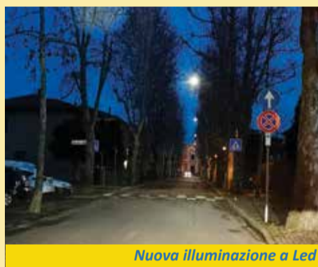
Nuova illuminazione a Led

L'intero territorio di Calderara avrà presto l'illuminazione a led. Si tratta di "opere di riqualificazione ai fini dell'efficientamento energetico", finanziate in parte grazie al Decreto Crescita e per il resto con risorse comunali. Eseguiti e portati a termine a gennaio di quest'anno i lavori per l'adeguamento degli impianti di Lippo e Longara, si passa ora a Calderara, quindi toccherà a Castel Campeggi e Tavernelle. Così il Comune prosegue il cammino verso la "Città sostenibile" intrapreso dalla nuova Amministrazione, avviandosi a far diventare Calderara una led city. Il costo complessivo relativo al primo stralcio è stato di 140 mila euro, e analoga somma è già stata stanziata per il 2020. Al termine del restyling gli apparecchi saranno tutti a led, più performanti e di ultima generazione. Il risparmio energetico sarà notevole: si passerà dai 140.532 kw consumati in media ogni anno a 44.647: il 68,23% in meno. ■