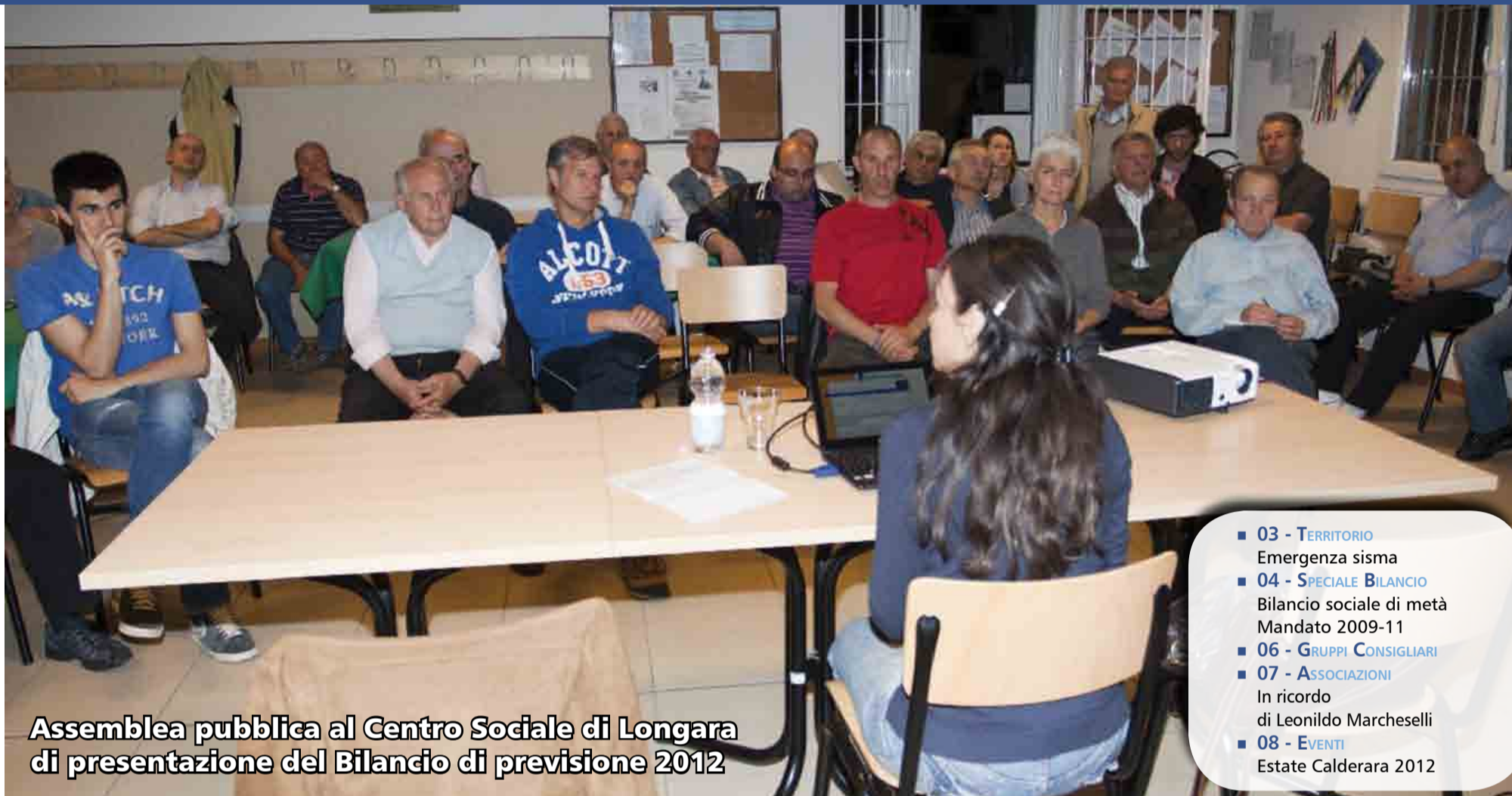
Assemblea pubblica al Centro Sociale di Longara di presentazione del Bilancio di previsione 2012

postazione contact info GIPALIERI10/2010 Posteitaliano