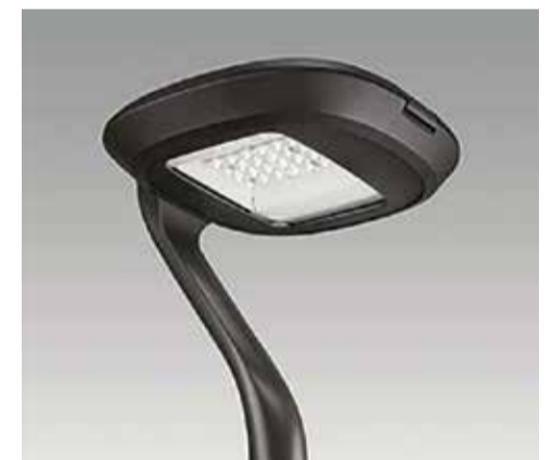
La tipologia di apparecchi che sarà installata col nuovo intervento

«Con questo intervento, proseguendo la strada intrapresa sin dal 2019 - commenta il Sindaco Giampiero Falzone -, puntiamo a un ulteriore risparmio energetico. Anche questa quarta tranche sarà importante per la sicurezza urbana, visto che la nuova pubblica illuminazione a led consentirà di migliorare la visibilità notturna, e, cosa che in questo periodo abbiamo a cuore, è in linea con la politica di tagli e risparmio intrapresa dall'Amministrazione: no agli sprechi, sì ad un consumo sostenibile». ■