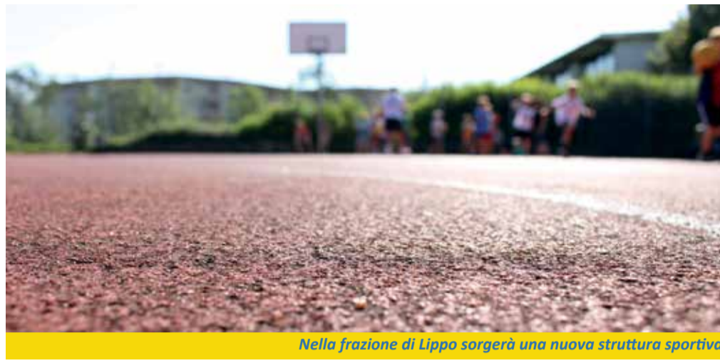
Nella frazione di Lippo sorgerà una nuova struttura sportiva

È il risultato dell'atto integrativo, sottoscritto di recente dalle due parti, che va a modificare la convenzione datata 2007 riguardante l'ambito urbanistico AP_3 "Storione", già comparto 136. Nel quadro di queste opere di urbanizzazione era previsto un ulteriore parcheggio pubblico, per l'appunto in via Crocetta, in aggiunta a quello già realizzato: il Comune ha però giudicato già soddisfacente lo standard di sosta raggiunto a Lippo, e