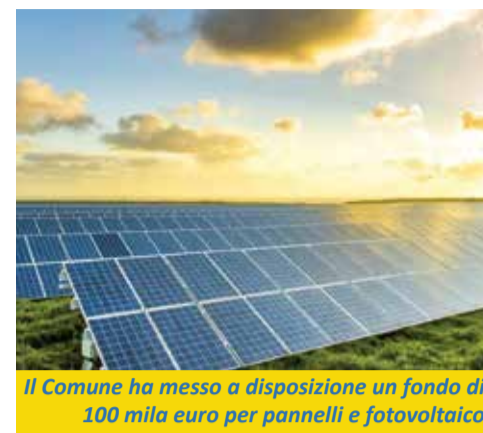
Il Comune ha messo a disposizione un fondo di 100 mila euro per pannelli e fotovoltaico

cato insieme alla domanda di partecipazione sul sito del Comune di Calderara, in ogni sua parte. L'obiettivo del bando è triplice: la tutela dell'ambiente, grazie all'abbattimento delle emissioni atmosferiche ottenuto mediante il progressivo incremento della produzione d'energia elettrica da fonti rinnovabili; promuovere la coesione economico-sociale, attraverso il progressivo incremento delle utenze beneficiarie; lo sviluppo economico del territorio, grazie al diffuso miglioramento dell'efficienza energetica. ■