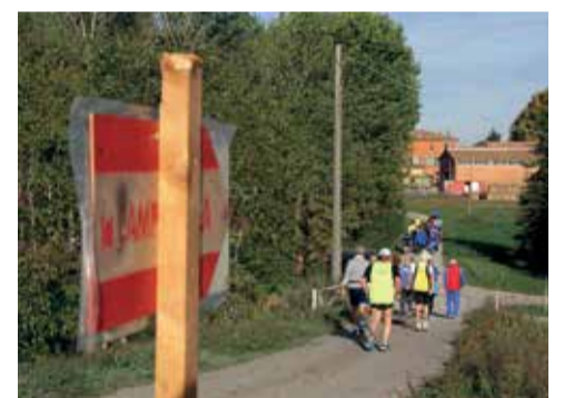
La Camminata Campagnola 2022

2 ottobre 2022: finalmente è arrivato il momento. Sono passati 2 anni dall'ultima edizione della Camminata Campagnola e sono successe tante cose come se ne fossero passati 20. Il Covid ha fermato l'Italia e ha fermato il movimento podistico. Poi timidamente si è cominciato con qualche manifestazione podistica, con attenzione, mantenendo il distanziamento ed evitando la socializzazione che è il sale di questo movimento. Alle prime camminate che si sono potute disputare la presenza era scarsa, erano sparite le partenze ufficiali e i ristori. Non è questo il podismo e molti purtroppo restavano a casa. Abbiamo atteso con pazienza. Ci siamo preparati e siamo stati premiati. La 18ª edizione della Camminata Campagnola è stata bella e per il G.P. Longara emozionante. La giornata piena di sole ha aiutato, le iscrizioni sono state numerose e la piazza di Longara era piena di gente. Il ristoro è stato all'altezza e il livello è tornato quello delle edizioni pre-covid. Dopo la premiazione (premi per tutti, singo-