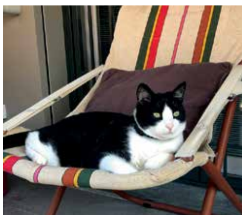
Un ospite del gattile Lo Stregatto

Se, per qualunque necessità, sei interessata o interessato a fissare un colloquio con il Servizio Sociale, telefona al numero 051-6461292 (sportello sociale) dalle 8.30 alle 12.30 per concordare un appuntamento. ■