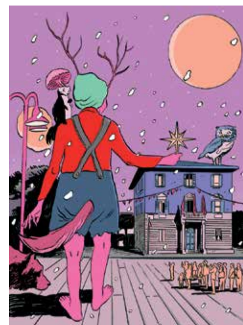
Viaggio d'inverno, l'illustrazione originale per il Natale 2022

Infine il 22 il concerto di Osteria del Mandolino & Orchestra Popolare dei Mandolini, in una serata in cui si ballerà e suonerà in allegria. ■