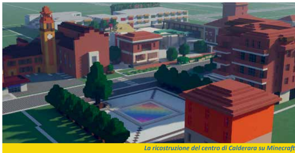
La ricostruzione del centro di Calderara su Minecraft

Potrebbe per esempio essere utilizzata come strumento che permetta ai ragazzi e alle ragazze di pensare e ripensare a nuovi spazi nella nostra città, contribuire quindi con le loro idee e vederle realizzate in anteprima, già contestualizzate all'interno del nostro territorio. Ad esempio: come ci starebbe un nuovo parco al posto di quel vecchio edificio? Con il modello di Calderara a Cubetti è possibile far progettare il nuovo spazio ai ragazzi e valutare quale impatto avrebbe sulla nostra comunità. Un altro campo di applicazione potrebbe essere la realizzazione di un nuovo tipo di social network, con il quale i giovani possono incontrarsi e parlare nella piazza virtuale, ricercare testi all'interno della biblioteca, assistere a spettacoli online nel teatro o organizzare eventi tematici. La mappa attualmente non è accessibile a tutti, ma presto verrà resa disponibile ai cittadini che vorranno esplorarla.