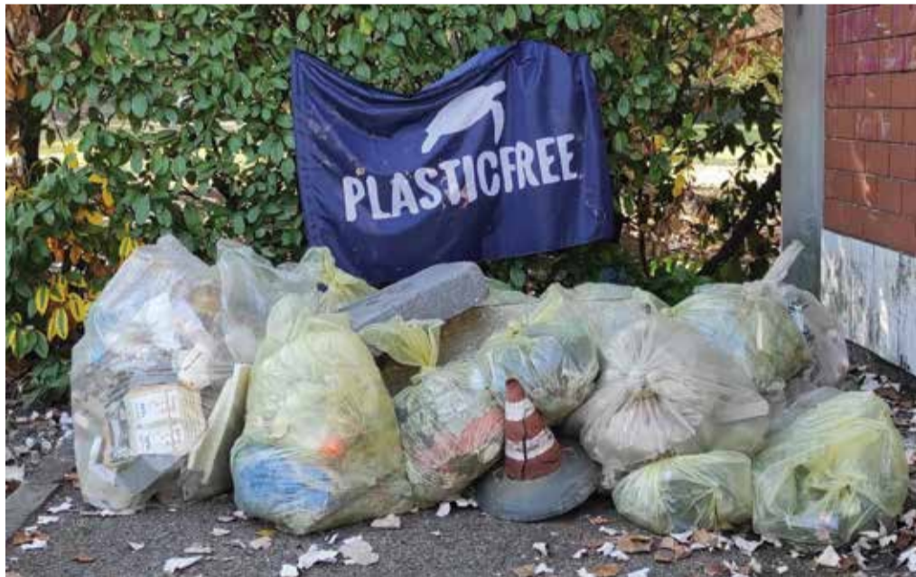
Il risultato della raccolta dello scorso 29 ottobre. A pagina 1 i volontari al lavoro

«Anche io sono una cittadina di Calderara e quindi parlo anche per me: prendendoci cura del territorio più vicino a noi, ci prendiamo cura anche di quello che è più lontano da noi, ma che non è scollegato, anzi sappiamo quanto in natura tutto abbia un equilibrio tanto accurato quanto delicato. Vedere persone che si incontrano, si conoscono, riflettono su quello che fanno e cooperano per prendersi cura dell'ambiente in cui vivono, in modo pacifico e rispettoso, è un insegnamento per tutti noi ed è un qualcosa che trasmette speranza. Chi ci vuole conoscere e contattare ci può trovare su www.plasticfreeonlus.it e sulle nostre pagine social di Calderara: presto ci saranno nuovi appuntamenti». ■