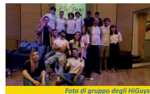
Foto di gruppo degli HiGuys

in uno stesso luogo e questa cosa ci ha caricati per pensare al punto di arrivo - che è anche un ulteriore punto di partenza - di questo primo anno di HiGuys: un'intera giornata di BOOM. La Casa della Cultura è il nostro “quartier generale”, è lì che pensiamo a come strutturare i nostri eventi e come fare in modo che riescano al meglio: in un certo senso, giocavamo in casa. Conoscendo gli spazi e le enormi possibilità offerte dalla Casa della Cultura ci siamo concentrati solo sulla riuscita del nostro progetto. “Gamelife”, la giornata di BOOM da noi organizzata, è stata importante non solo per noi, ma per la comunità. C'erano laboratori, musica live e tante realtà di giovani imprenditori e artisti del territorio a raccontare la loro storia di fronte a un pubblico di tutte le età.