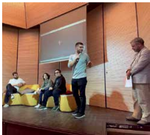
La presentazione durante BOOM 2022

In questo gioco, per PC e console, il videogiocatore può costruire edifici, monumenti, fortini e qualsiasi altra cosa gli venga in mente: l'unico limite è la fantasia. La sua semplicità è tale che chiunque si può avvicinare al gioco senza avere alcun tipo di abilità o conoscenza, grazie alla sua organizzazione a cubi. Questa sua peculiarità gli ha permesso di diventare uno dei videogiochi più venduti della storia. Potremmo quasi paragonarlo, in termini di popolarità, al vecchio videogioco Pac-Man. Avere una copia della città come questa apre le porte a moltissime possibilità di applicazione.